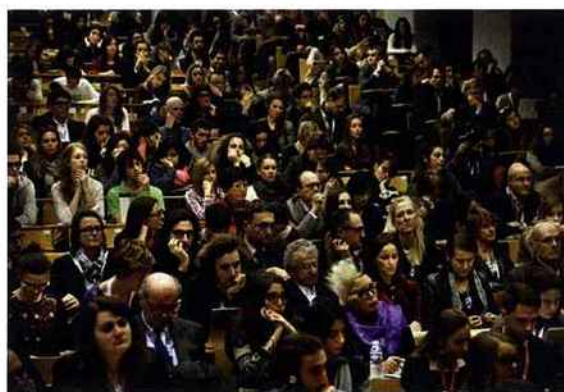
Débat du Forum d'Avignon 2013 avec les étudiants, sur le thème : « les pouvoirs de la culture ». Université d'Avignon.

> Après Avignon et Paris, la ville de Bordeaux accueillera la prochaine édition des Rencontres internationales du Forum d'Avignon, les 31 mars et 1 er avril 2016. Selon les organisateurs, « la métropole aquitaine a été choisie pour la richesse et le rayonnement de son offre culturelle ainsi que le dynamisme de son tissu économique ». Ce transfert « sera l'occasion de mettre en scène une nouvelle formule pour ces Rencontres encore plus internationales et créatives qui réuniront des personnalités charismatiques, porteuses de vision et de projets pour développer la place de la culture dans nos sociétés européennes », explique Hervé Digne, président du Forum d'Avignon. De son côté, Alain Juppé, maire