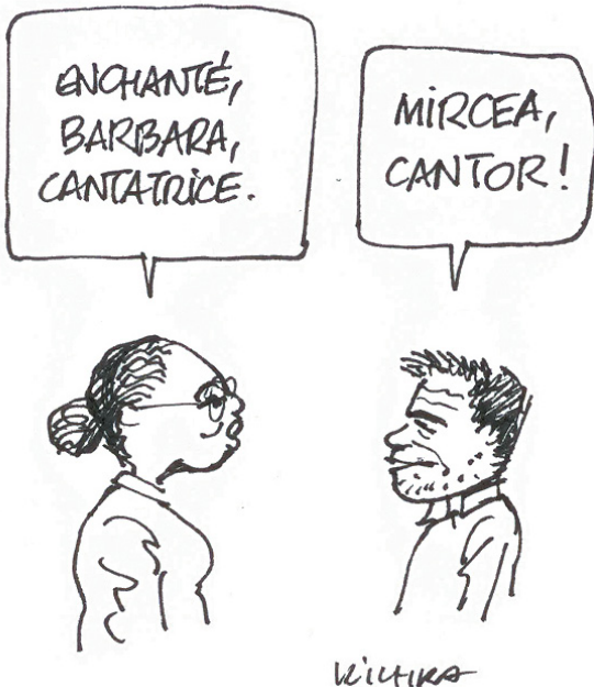
Barbara Hendricks and Mircea Cantor, Kichka