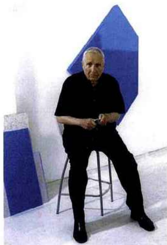
Gottfried Honegger en 2007.

> La faucheuse qui en ce début d'année a ravi chanteurs et musiciens, de Pierre Boulez à David Bowie, a fait une nouvelle victime : l'artiste suisse Gottfried Honegger, tenant de l'art concret, décédé hier, dimanche 17 janvier. Né en 1917 à Zürich, Gottfried Honegger s'intéresse aux recherches de Max Bill et Joseph Albers avant de se rendre à New York à la fin des années 1950. Il y fait ses premiers